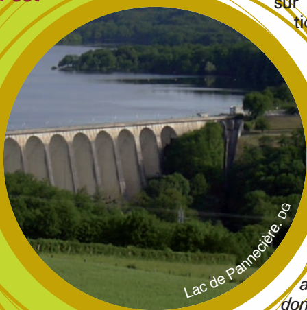
Lac de Pannecière. DG

L'arrivée de la fibre optique au cœur des hameaux est alors facilitée.