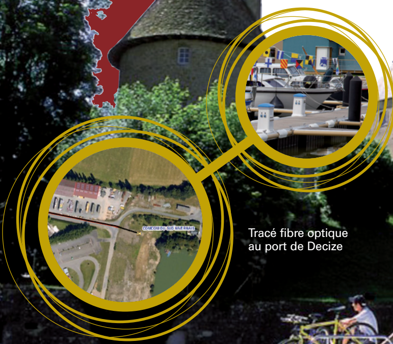
Tracé fibre optique au port de Decize

Niverlan a été choisi par le Syndicat Mixte d'Équipement Touristique du Canal du Nivernais comme Assistant à Maîtrise d'Ouvrage afin de rédiger l'étude de faisabilité technique.